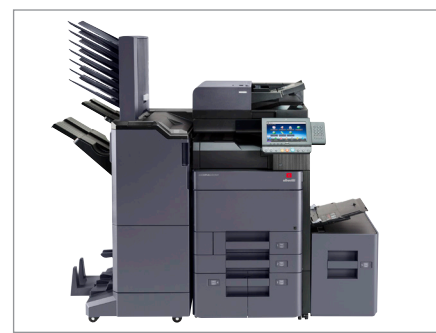
d-Copia 6000MF mit DP-7110 + PF-7110 + PF-7120 + DF-7110 + BF-730 + MT-730