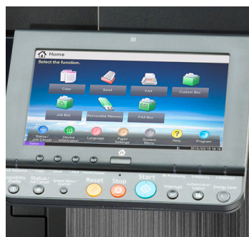
Großes, benutzerfreundliches 9" Farb-Touch-Display