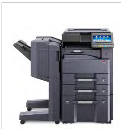
d-Copia 3201MF (bzw. d-Copia 4001MF) + Abdeckung Typ (E) + PF-810 + DF-7120 + AK-740