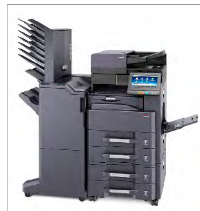
d-Copia 3201MF (bzw. d-Copia 4001MF) + DP-7110 + PF-791 + DF-7110 + AK-740 + MT-730(B)