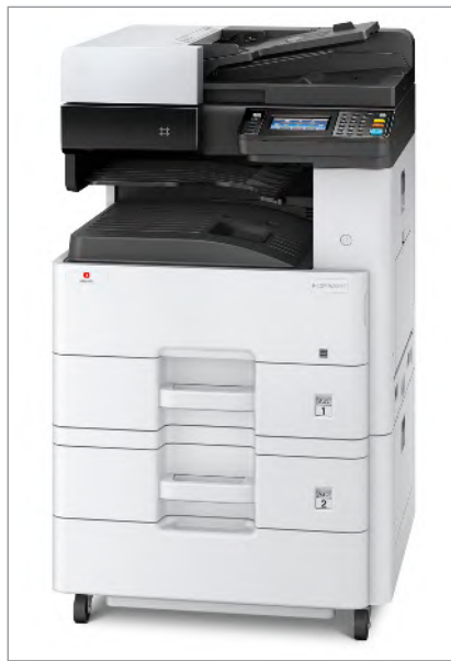
d-Copia 255MF mit optionaler Papierkassette PF-470