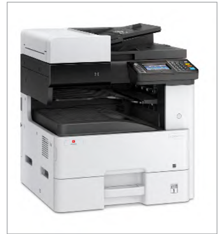
d-Copia 255MF Standardkonfiguration