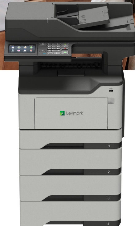
XM1246 mit optionalen Fächern

Zuverlässigkeit. Sicherheit. Produktivität.