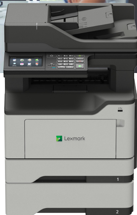
XM1242 mit optionalem Fach

Zuverlässigkeit. Sicherheit. Produktivität.